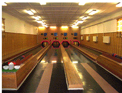
Kuželna ve Strašnicích byla pro Mistrovství velmi dobře připravena. Jen ty kuželky mohly být již nové.