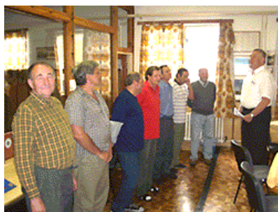
A tady je již závěrečné vyhlášení výsledků Mistrovství Prahy 2006 v kategorii seniorů.