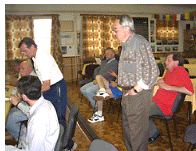
Mezi diváky nechybí zástupce PKS K.Kochánek, který si netroufá odhadnout konečné výsledky.