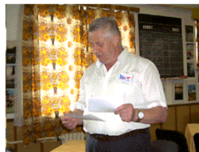
Podrobné konečné výsledky Mistrovství vyhlásil hlavní rozhodčí M.Navrátil