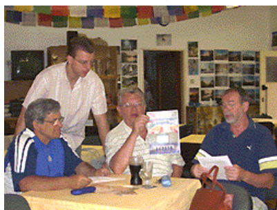
Borci z Konstruktivy se chlubí s plány, jak bude vypadat jejich kuželna - uvidíme ...