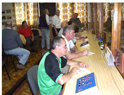
U zapisovacích stolků všichni hráči pečlivě sledují průběh hry