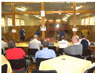
Také diváci se baví. Oceňují dobrou hru a soucítí s těmi, co se na buchtách trápí ...