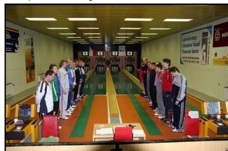
Slavnostní nástup na Mistrovství ČR mužů 2008.