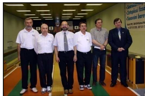
Zástupci ČKA, delegáti a rozhodčí.