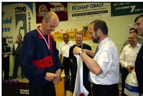
Dres Mistra ČR se neobléká každý den.