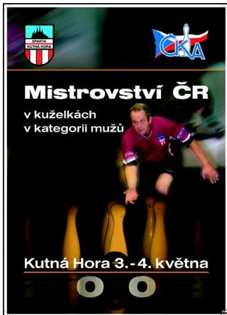
Oficiální plakát Mistrovství ČR.