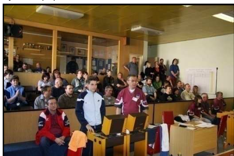
Diváci měli stále co obdivovat.