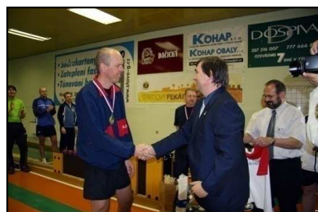
Blahopřání prezidenta ČKA novému Mistrovi ČR

Převzato. Rozsáhlou fotoreportáž z Mistrovství ČR naleznete na adrese http://www.halfar.foto24.cz/Kuzelky_rok_2008/MCR_2008_muzi/tpage00001.htm