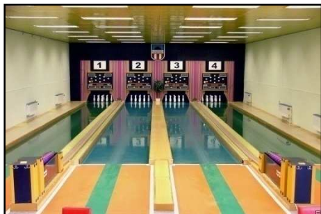
Výborně připravená kuželna v Kutné Hoře.