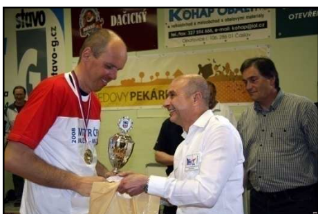
A k němu patří i pohár.